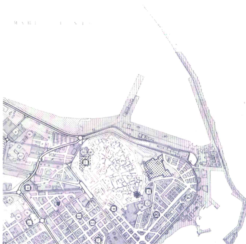
Figura 2: Stralcio PRG 1980 TAV 4.1